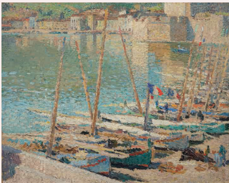
アンリ・マルタン《コリウール》1923年、フランス、個人蔵