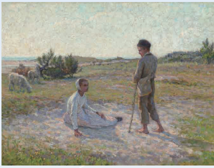
アンリ・シダネル《エタプル、砂地の上》1888年、フランス、個人蔵