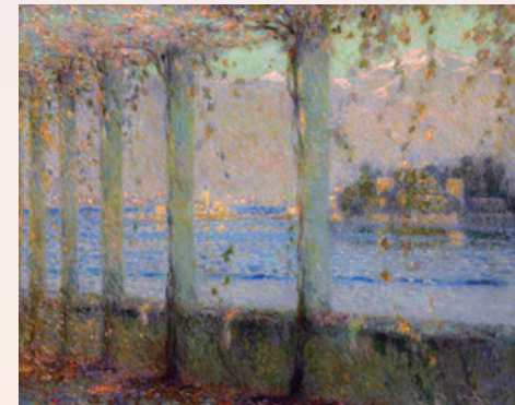
アンリ・シダネル《イゾラ・ベッラ、ブドウ壺》1909年、メス・メトロポール、クール・ドール博物館、Inv.418

※会場内の温湿度と明るさは、作品の保存に適した値まで下げています。ご理解のうえ体温調節ができる服装でのご来館をお勧めします。