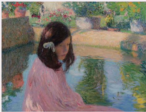
アンリ・マルタン《池》1910年以前 フランス、ピエール・バスティド・コレクション