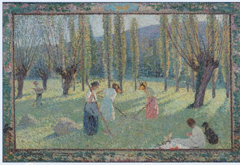
アンリ・マルタン《二番草》1910年、フランス、個人蔵