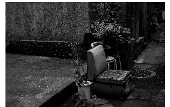
ワークショップでの撮影イメージ