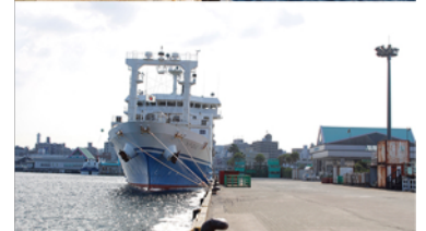
2方向の撮影写真サンプル