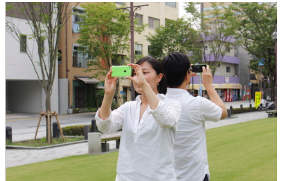
ワークショップイメージ

例えばチームの1人が南埠頭から桜島を撮影した場合、もう1人は自動的にその反対にあるものを撮影しなければいけません。普段から親しんでいる桜島の反対側にはなにがあるのか――。南の離島へと向かう準備をする人々を乗せた大きなフェリー? 釣りをする親子連れや近所の方々? このワークショップを通して、わたしたちが意識する風景の裏側にあるものに目を向け、カメラを通して切り取ることで、そこにはあたらしい風景が浮かび上がってくることでしょう。